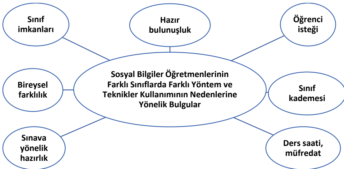
Şekil 3.Sosyal bilgiler öğretmenlerinin farklı sınıflarda farklı yöntem ve teknikler kullanmasının nedenlerine yönelik bulgular

Sosyal bilgiler öğretmenlerinin farklı sınıflarda farklı yöntem ve teknikler kullanmasının nedenlerine yönelik bulgular, Şekil 3’te gösterilmiştir: