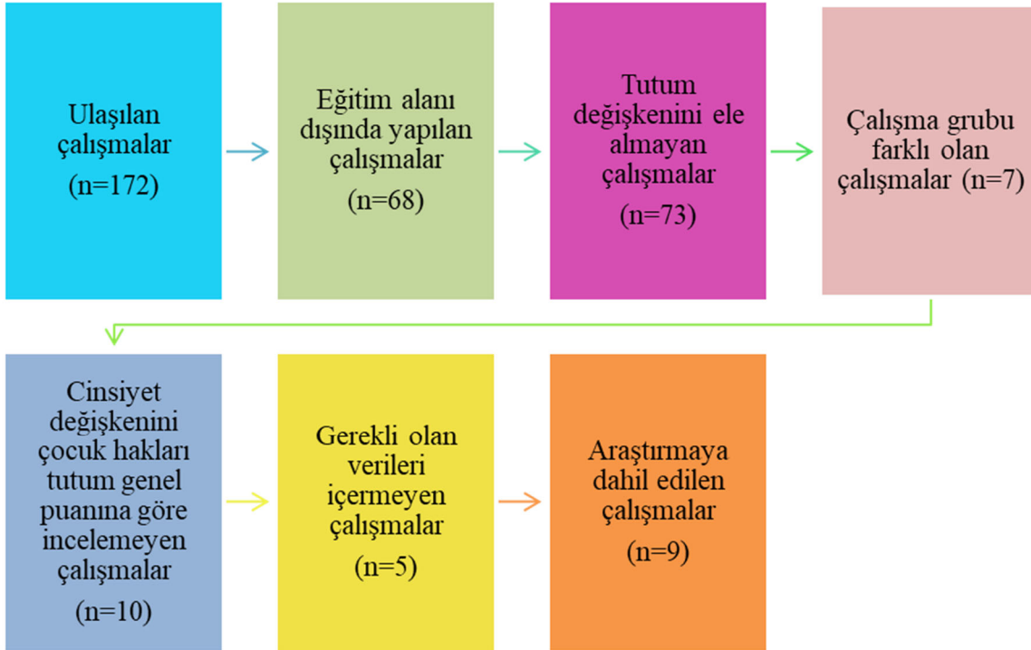
Şekil 1. Akış diyagramı

Literatür taraması sonucunda elde edilen araştırmalar değerlendirildiğinde ve daha önce belirlenen dahil edilme kriterlerine uygun olan dokuz araştırmanın meta-analize dahil edilmesine karar verilmiştir. Söz konusu çalışmaların meta-analiz araştırmasına dâhil edilme sürecine yönelik akış diyagramı Şekil 1'de gösterilmiştir.